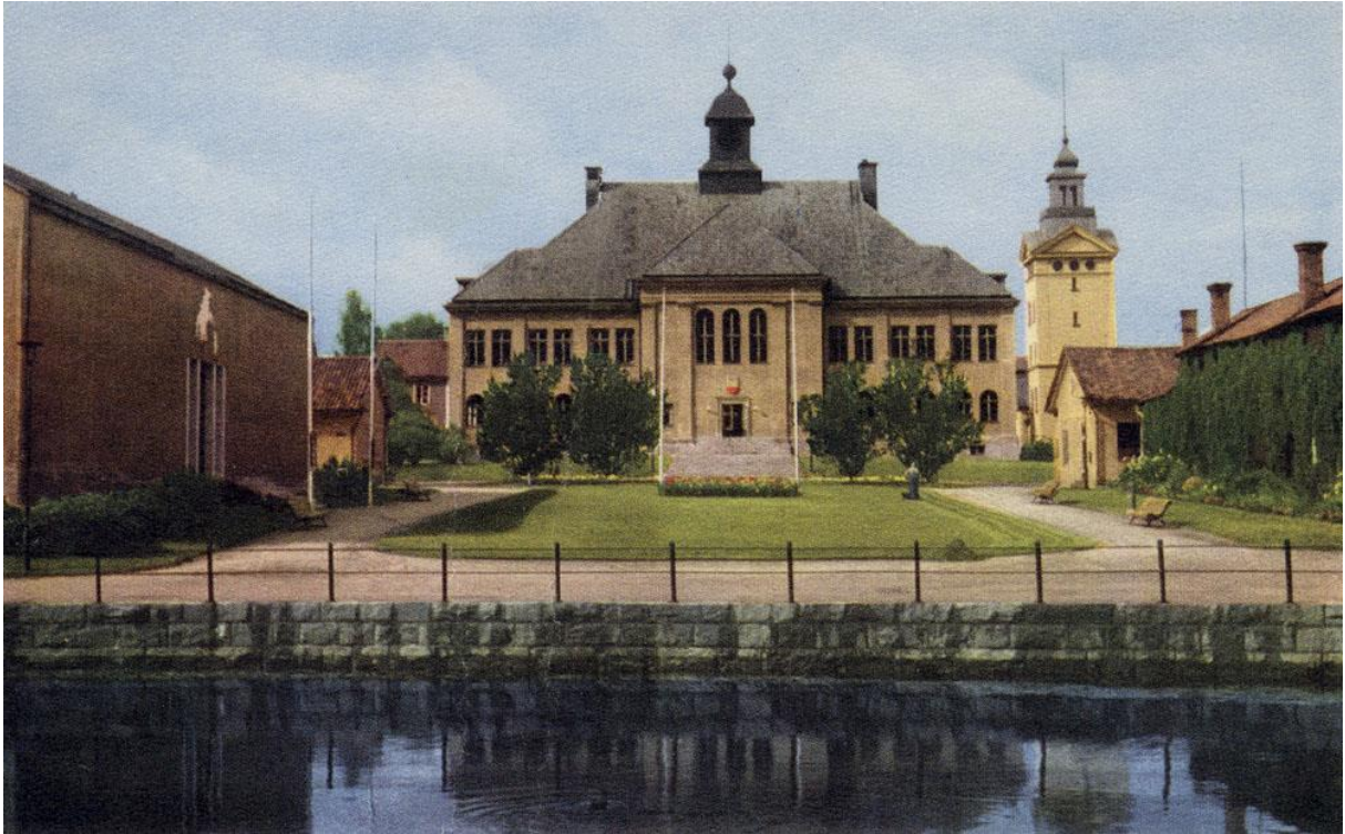
Medborgarhuset med biblioteket