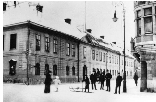
Bergslagens hus före ombyggnaden

En variant av biblioteks-föreningarna som sakta men säkert ökade från och med slutet av 1700-talet, var läsesällskapen. På 1840-talet omtalas två läsesällskap i Falun: Falu läsesällskap och Athenaeum. Förmodligen hade de båda ett nära samarbete.