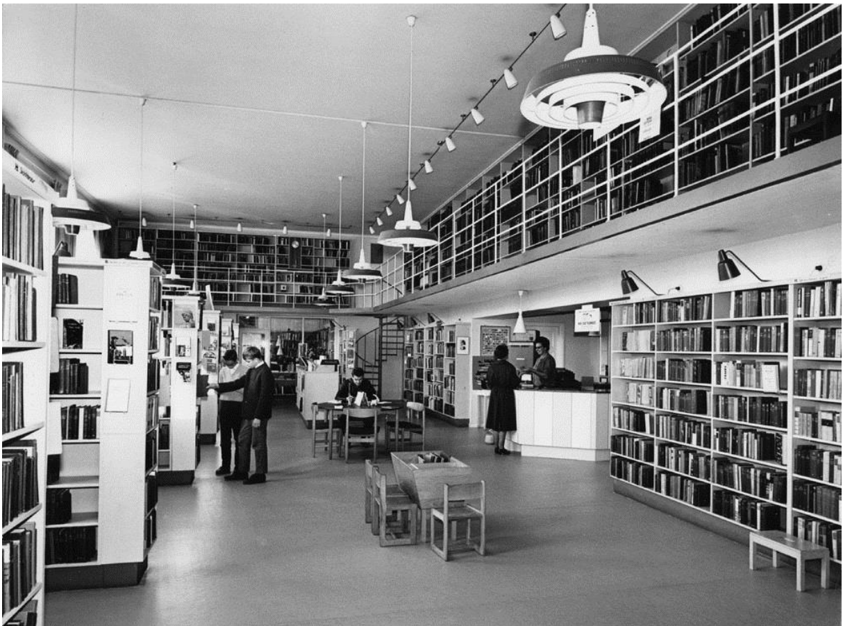
Interiör av biblioteket i Medborgarhuset