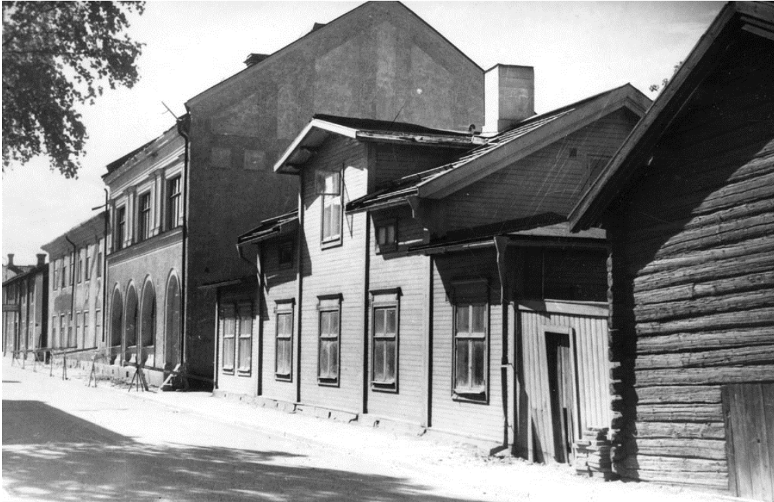
Biblioteket vid Sturegatan (tvåvåningshuset)

Den 9 oktober 1907 öppnade dåvarande utskänkningsbolaget i Falun, med hjälp av Falu Besparingsfond, en läsestuga vid Sturegatan efter mönster från Göteborg. Där kunde man läsa tidningar och dricka kaffe.